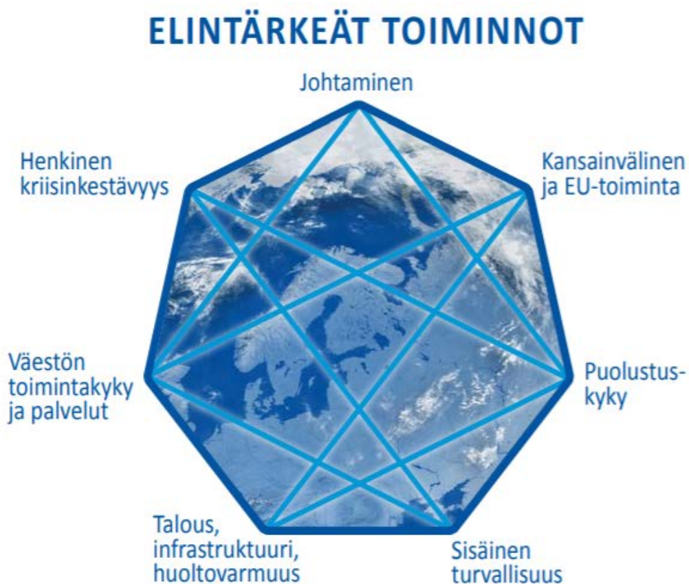
Kuva 1 Yhteiskunnan elintärkeät toiminnot (Turvallisuuskomitea 2017, 14)

Valtioneuvoston periaatepäätöksessä Yhteiskunnan turvallisuusstrategia Suomalaisen yhteiskunnan elintärkeiksi toiminnoiksi on määritelty seitsemän toimintoa, joiden jatkuvuus on pystyttävä takaa kaikissa turvallisuustilanteissa (Turvallisuuskomitea 2017, 14).