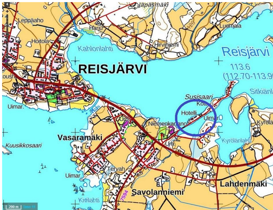
ALUEEN YLEISSIJAINTI. MUUTOSALUE SINISEN YMPYRÄN SISÄLLÄ

Kaavoitustyön tarkoituksena on muuttaa asemakaavaa siten, että alueella toimivan matkailuyrityksen toiminnan ja jatkorakentamisen toteuttaminen on mahdollista ja tarkoituksenmukaista. Alueen yleissijainti ja voimassa oleva kaava ovat oheisilla kartoilla.